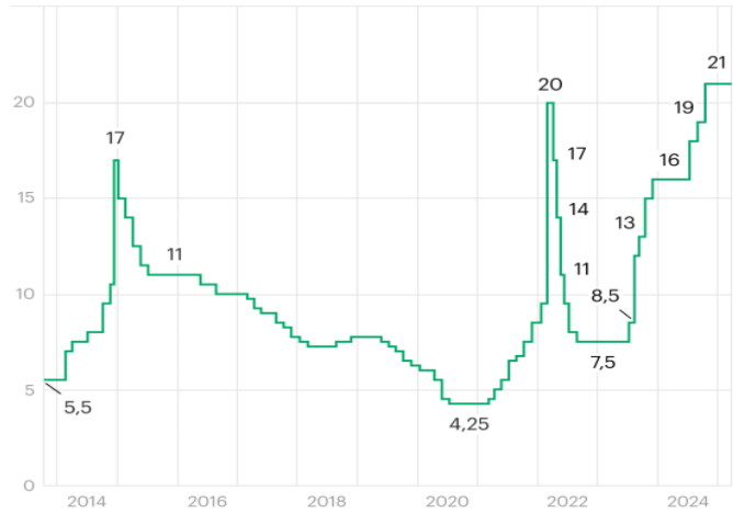
Рисунок 2. Изменение ключевой процентной ставки ЦБ РФ в 2013–2025 гг. [1]